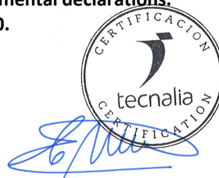
Carlos Nazabal Alsua Manager

Issued date / Fecha de emisión: 22/07/2024 Update date / Fecha de actualización: 22/07/2024 Valid until / Válido hasta: 19/07/2029 Serial N° / N° Serie: EPD1060800-E