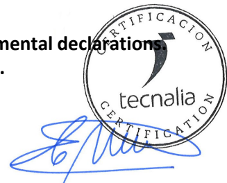
Carlos Nazabal Alsua Manager

Issued date / Fecha de emisión: 22/07/2024 Update date / Fecha de actualización: 22/07/2024 Valid until / Válido hasta: 19/07/2029 Serial Nº / Nº Serie: EPD1060700-E