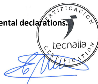
Carlos Nazabal Alsua Manager

Issued date / Fecha de emisión: 22/07/2024 Update date / Fecha de actualización: 22/07/2024 Valid until / Válido hasta: 19/07/2029 Serial Nº / Nº Serie: EPD1060400-E